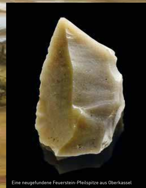
Eine neugefundene Feuerstein-Pfeilspitze aus Oberkassel