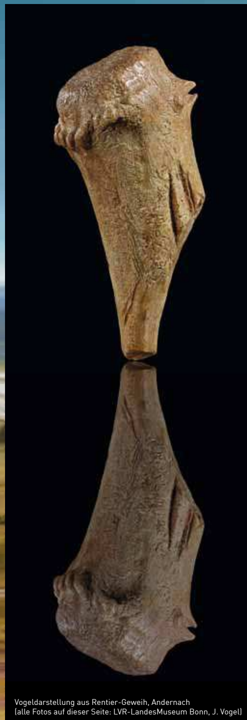
Vogel­darstellung aus Rentier-Geweih, Andernach

Der Begleitband erscheint im Nünnerich-Asmus Verlag, Mainz. Ca. 348 Seiten, mit ca. 240 farbigen Abbildungen, gebunden. Sonderpreis im Museumsshop 19,90 €, überall im Buchhandel für 29,90 € erhältlich (ISBN: 978-3-943904-80-2)