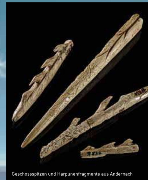
Geschosspitzen und Harpunenfragmente aus Andernach