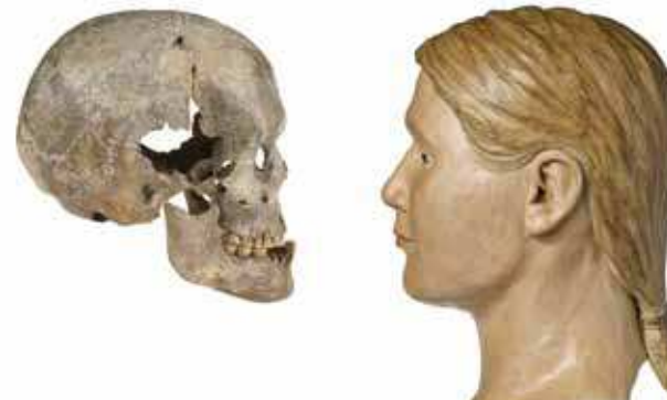
Vergleich Schädel und Gesichtsrekonstruktion der beiden Oberkasseler Menschen (Rekonstruktion C. Niess)

info@kulturinfo-rheinland.de , Tel 02234 9921-555. „Infopoint Museumspädagogik“ im Museumsfoyer unter 0228 2070-277 (Di-Fr 9-13Uhr)