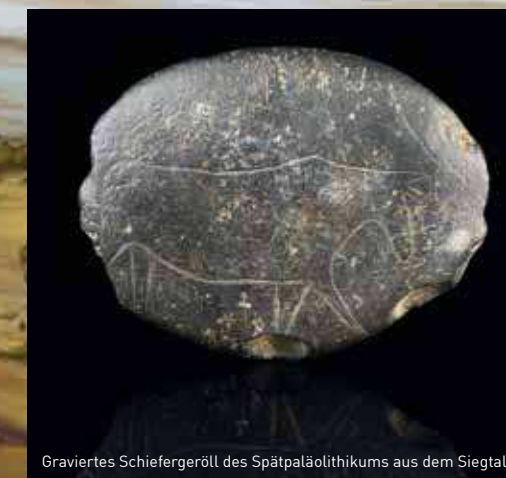
Graviertes Schiefergeröll des Spätpaläolithikums aus dem Siegtal